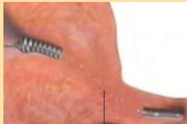
Vücut dokuları Essure mikro-araç doğru büyüyerek fallop tüpünü tıkar.