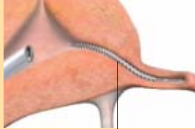
Fallop tüpünde Essure mikro-araç